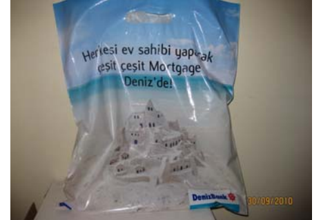
Daire Kapıları – Sabah Servisi – Poşet Üzerine Reklam Alınabilir.