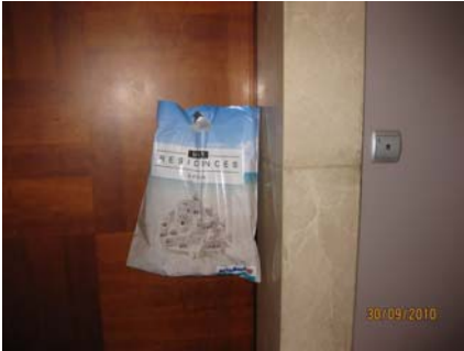
Daire Kapıları – Sabah Servisi – Poşet Üzerine Reklam Alınabilir.