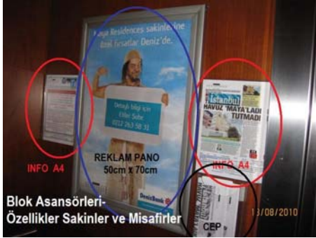
Blok Asansörleri – Özellikle Sakinler ve Misafirler