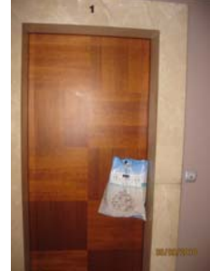
Daire Kapıları – Sabah Servisi