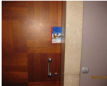
Daire Kapıları – Broşür Tanımlı Kataloglar

Stickerlama istenirse artı -250,00 TL (İki Yüz Elli Türk Lirası)