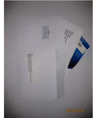
Aidat Ekstresi Beraberinde

Diğer Uygulamalar ise aşağıda anlatılmıştır.