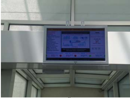
Atrium –Sakinler ve Özellikle Misafirler