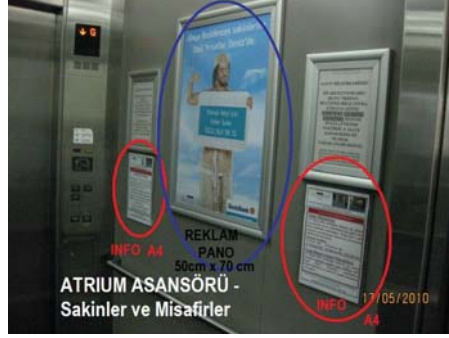
Atrium Asansör –Sakinler ve Misafirler

Maya Residences Etiler kompleksinde tüm yaşayan sakinler otoparklardan kendilerine özel asansör çıkışları ile bloklarına ulaşmakta ve dairelerine asansörler vasıtası ile çıkmaktadırlar.