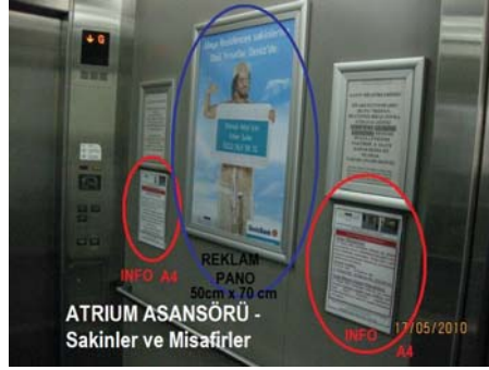
Atrium Asansör –Sakinler ve Misafirler

Maya Residences Etiler kompleksinde tüm yaşayan sakinler otoparklardan kendilerine özel asansör çıkışları ile bloklarına ulaşmakta ve dairelerine asansörler vasıtası ile çıkmaktadırlar.