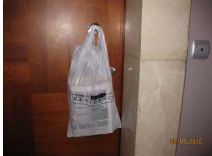
Daire Kapıları – Sabah Servisi – Poşet Üzerine Reklam Alınabilir.