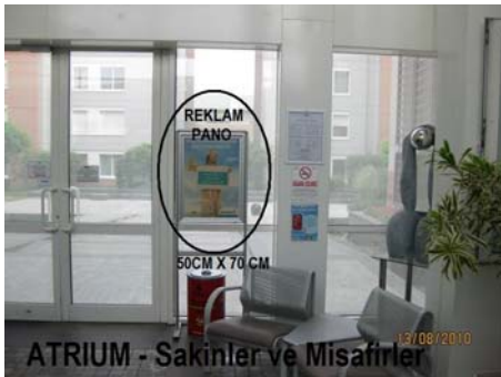
Atrium –Sakinler ve Özellikle Misafirler

Aşağıdaki uygulamalarda adı geçen REKLAM PANO 'ları 14 adet KONUT BLOĞUMUZUN MÜŞTERİ ASANSÖRLERİNDE, SİTE MİSAFİRLERİMİZİN GİRİŞ YAPTIĞI ATRIUM ASANSÖRÜMÜZDE ve PRIVATE LOUNGE SOSYAL CAFE-RESTAURANTININ GİRİŞİNDE bulunmaktadır. Bilindiği üzere tüm sakinlerimiz hangi katta otururlarsa otursunlar Otopark katından mecburen bu asansörleri kullanarak evlerine çıkabiliyorlar. Her sakinin ve misafirin göreceği "Tam Hedef" noktalarıdır.