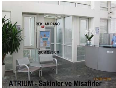
Atrium –Sakinler ve Özellikle Misafirler

REKLAM PANO 'ları 16 adet olup, Panoların ölçüsü 50 cm x 70 cm dir.