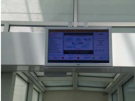
Sosyal Alanlar Özellikle Sakinler

Aşağıdaki uygulamalarda adı geçen RESIDENCE TV'ları 14 adet KONUT BLOĞUMUZUN MÜŞTERİ ASANSÖRLERİNDE, SİTE MİSAFİRLERİMİZİN GİRİŞ YAPTIĞI ATRIUM ASANSÖRÜMÜZDE ve PRIVATE LOUNGE SOSYAL CAFE-RESTAURANTININ GİRİŞİNDE bulunmaktadır. Bilindiği üzere tüm sakinlerimiz hangi katta otururlarsa otursunlar Otopark katından mecburen bu asansörleri kullanarak evlerine çıkabiliyorlar. Her sakinin ve misafirin göreceği "Tam Hedef" noktalarıdır.