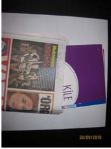
Daire Kapıları – Broşür Tanımlı Kataloglar