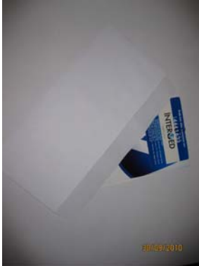
Daire Kapıları – Davetiye tanımlı Zarflar

Stickerlama istenirse artı -250,00 TL (İki Yüz Elli Türk Lirası)