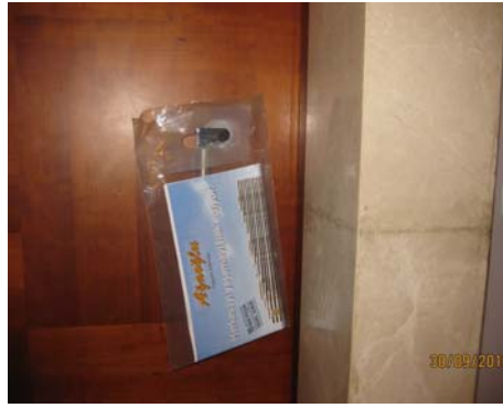
Daire Kapıları – Broşür Tanımlı Kataloglar